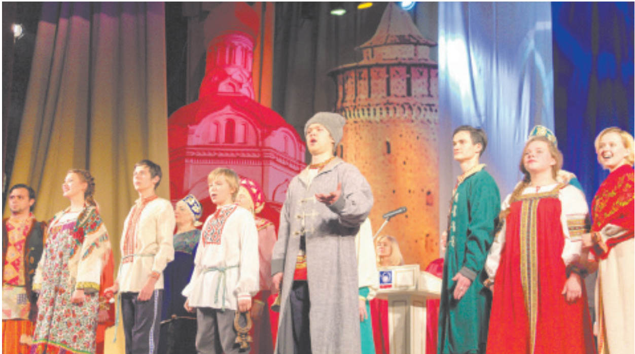
Концерт с участием творческих коллективов Королёва