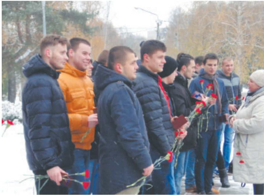
Молодёжь готова служить