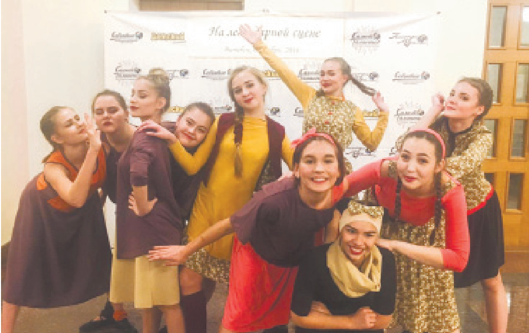
Легендарный ансамбль «Арлекино»

ТВОРЧЕСКИЕ КОЛЛЕКТИВЫ ДЕЛОВОГО И КУЛЬТУРНОГО ЦЕНТРА «КОСТИНО» НЕ ПЕРЕСТАЮТ РАДОВАТЬ ПОБЕДАМИ. НАЧАЛО НОЯБРЯ УЖЕ ОЗНАМЕНОВАЛОСЬ ГРОМКИМИ ДОСТИЖЕНИЯМИ ЮНЫХ ОДАРЁННЫХ ТАНЦОРОВ И ПЕВЦОВ.