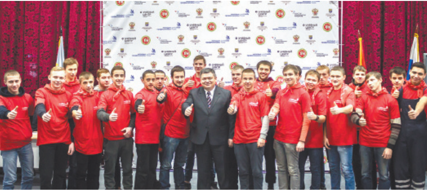
На отборочный этап чемпионата приехали юные мастера со всего Подмосковья

Напомним, что 28 июня в техникуме имени С.П. Королёва на заседании организационного комитета по подготовке и проведению мирового чемпионата по профессиональному мастерству по стандартам WorldSkills в Казани в 2019 году заместитель председателя правительства Российской Федерации Ольга Голодец за-