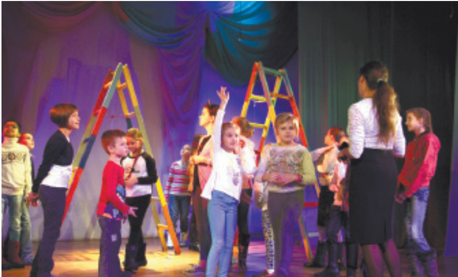
Юные королёвцы познакомились с жизнью театра